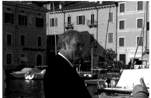
Alberto Juantorena al porto di Gargnano