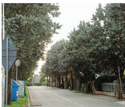
I pini argentati di viale delle Fiamme Verdi

«Sporcano e sono malandati»: al loro posto potrebbero sorgere parcheggi