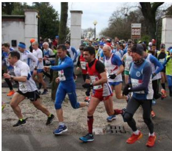
Una delle fasi iniziali della corsa