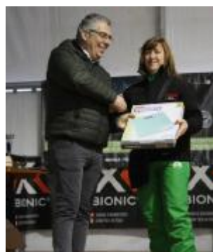
Il Montegargnano premiato

LEGARE. Un week-end pieno di appuntamenti